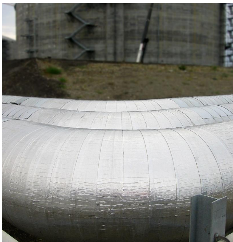
Lámina de Protección reforzada con goma butílica